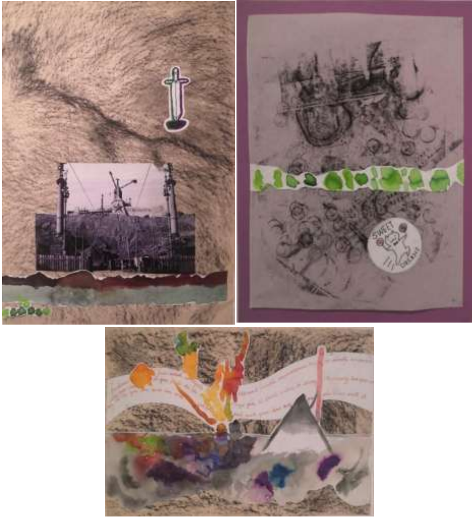
صورة ٢: نماذج مشاركة من التشيك