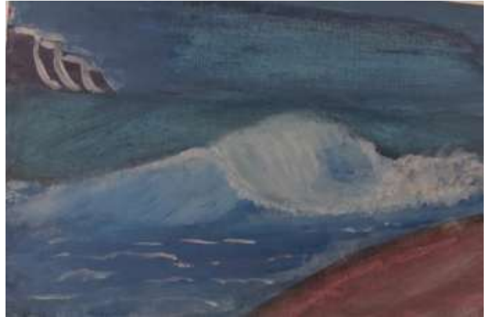
صورة ٧: نماذج من السعودية