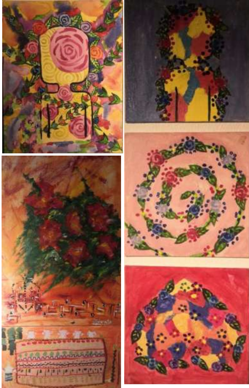
صورة ٣: نماذج من رومانيا

يتضح من خلال النماذج السمات والخصائص العامله لفنون الاطفال من تسطيح وشفافية وبعثرة الأشكال في بناء التكوين وغيرها .... ولكن اتضح أكثر أثر البيئة المحيطة والثقافة المجتمعية والتأثر بطبيعة المناخ لدولة التشيك والضبابية في الأعمال واستخدامهم لعناصر معمارية أو زخرفية من تراث بلدهم.