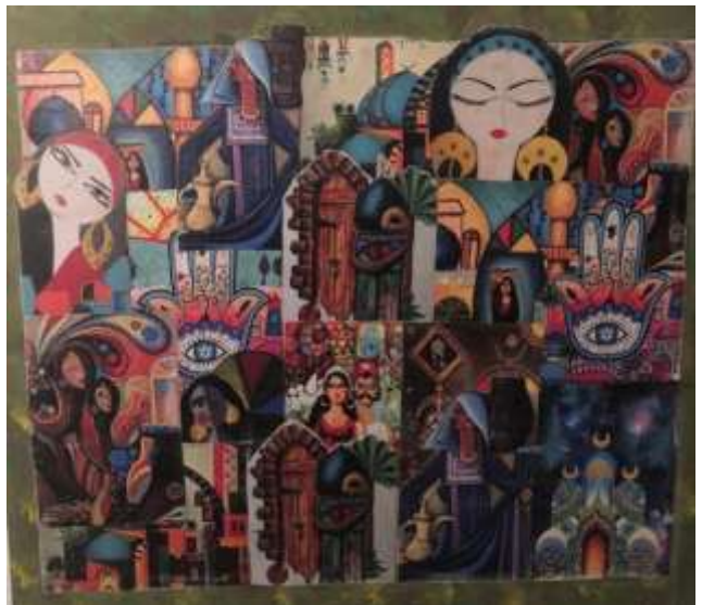
صورة ٨: نماذج من مصر

أثر البيئة المصرية يظهر في رسوم الاطفال من خلال اختيار الموضوعات وأشكال التعبير عنها والتأثر بزيارة الأماكن الأثرية والتاريخية واستخدام الزخارف والملابس الشعبية البسيطة النابعة من البيئة المصرية وكذلك تمثيل الموضوعات الحياتية المعروفة للعامة.