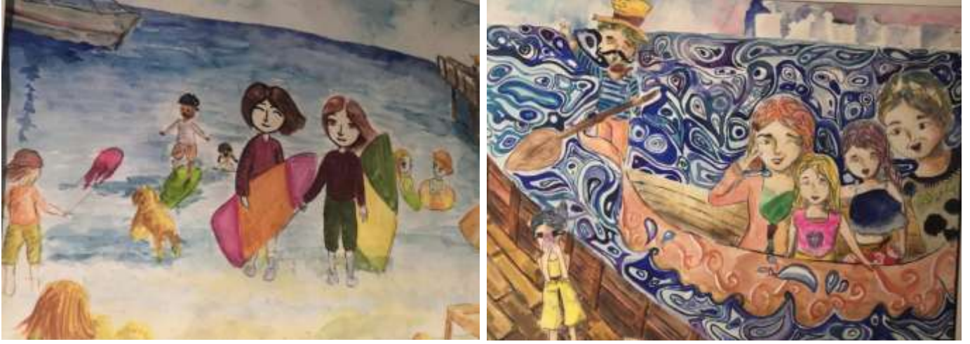
صورة ٥: نماذج من كوريا

عبر الاطفال عن ذويهم بطريقه بسيطة وسلسلة يظهر من خلالها هدوء البيئة المحيطة بهم، وايضاً من خلال رسمه لملامح الوجوه القريبه من الواقعية واستخدام الملابس اليومية البسيطة، وكذلك اوضاع التصوير الفوتوغرافي المشهورة لدى الكوريين.