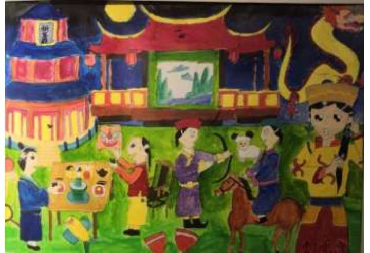
صورة ٤: نماذج من الصين